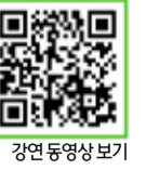
강연 동영상 보기