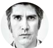
알레한드로 아라베나 Alejandro Aravena

이처럼 건축의 공공서비스적 측면을 강조하고 주민 참여 설계를 중요시한 알레한드로의 철학은 단순히 보기 좋은 건축물을 만드는 것이 아니다. 이해관계자들의 이익을 극대화하면서도 용적률의 제약 속에서 만들 수 있는 건축물의 창의성을 표현하는 것. 이는 알레한드로 아라베나가 말하는 건축 철학의 혁신과 통합적 사고를 보여주는 것이자 앞으로의 세계 건축의 방향을 보여준다.