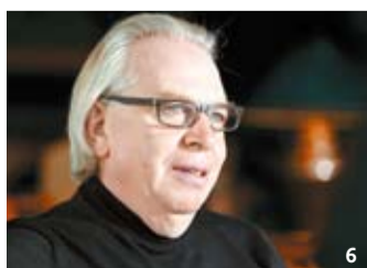
1 신사옥 5층과 7층, 17층에 마련된 옥상 정원 '루프 가든'. 2, 5 아모레퍼시픽 신사옥 외관 전경. 3 에스컬레이터를 감싼 콘크리트는 균일한 표시 없이 거꾸집을 공들여 제작했다. 4 지하에 들어선 카페. 건물 바닥은 포천에서 나는 화강석을 강한 불로 구운 소재를 사용했다. 6 데이비드 치퍼필드.