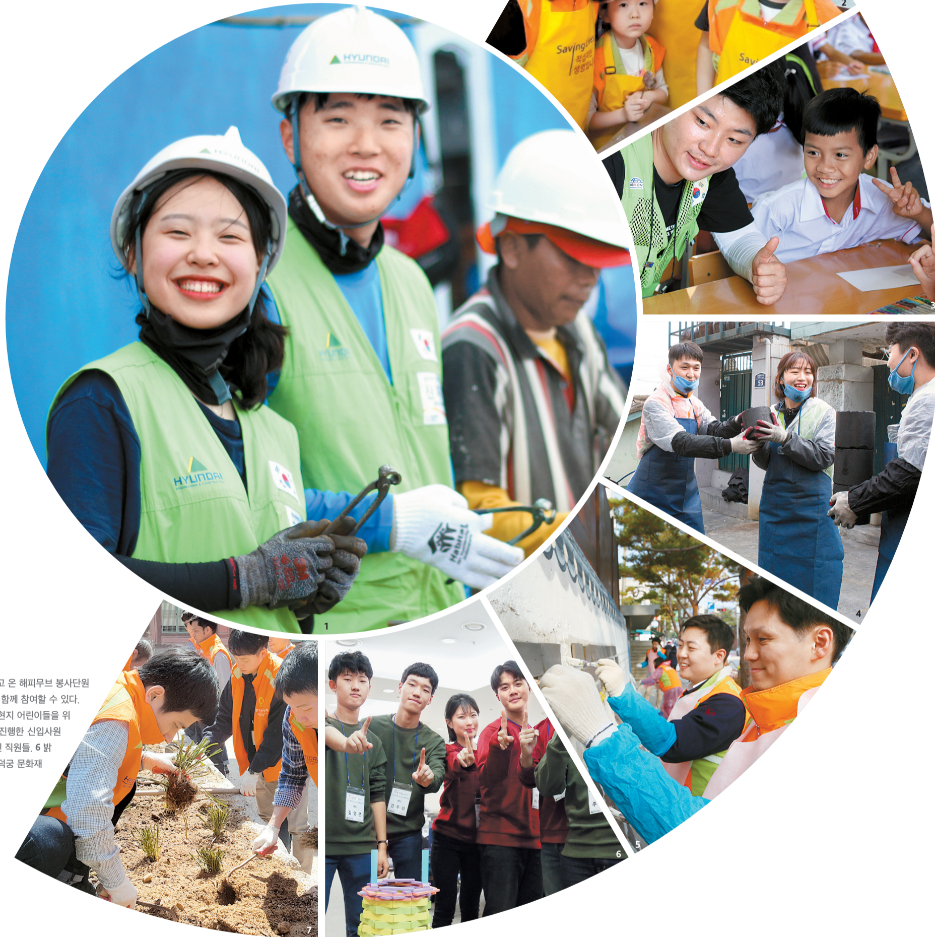
1 인도네시아 팔레방에서 봉사활동을 펼치고 온 해피무버 봉사단원들. 2 사랑의 재능 봉사는 임직원과 가족이 함께 참여할 수 있다. 3 해외 기술 봉사단 H-CONTECH 2기는 현지 어린이들을 위한 교육 봉사에도 최선을 다했다. 4 올 초 진행된 신입사원 연탄 배달 봉사. 5 북촌 미관 개선 활동 중인 직원들. 6 밝은 모습의 꿈키움 멘토링 봉사단 4기. 7 청역공 문화재 지킴이 봉사활동 모습.

2018 사회공헌 활동 결산 우리 회사가 도움이 필요한 국내외 지역에 사랑의 손길을 보내고 있다. 올해 사회공헌 활동에 참여한 직원 수는 3883명. 이들의 봉사시간을 모두 합치면 2만3810시간에 이른다. 지난 1월부터 11월까지 한 해 동안 진행한 우리 회사의 사회공헌 활동을 총 정리한다. 글=박현희