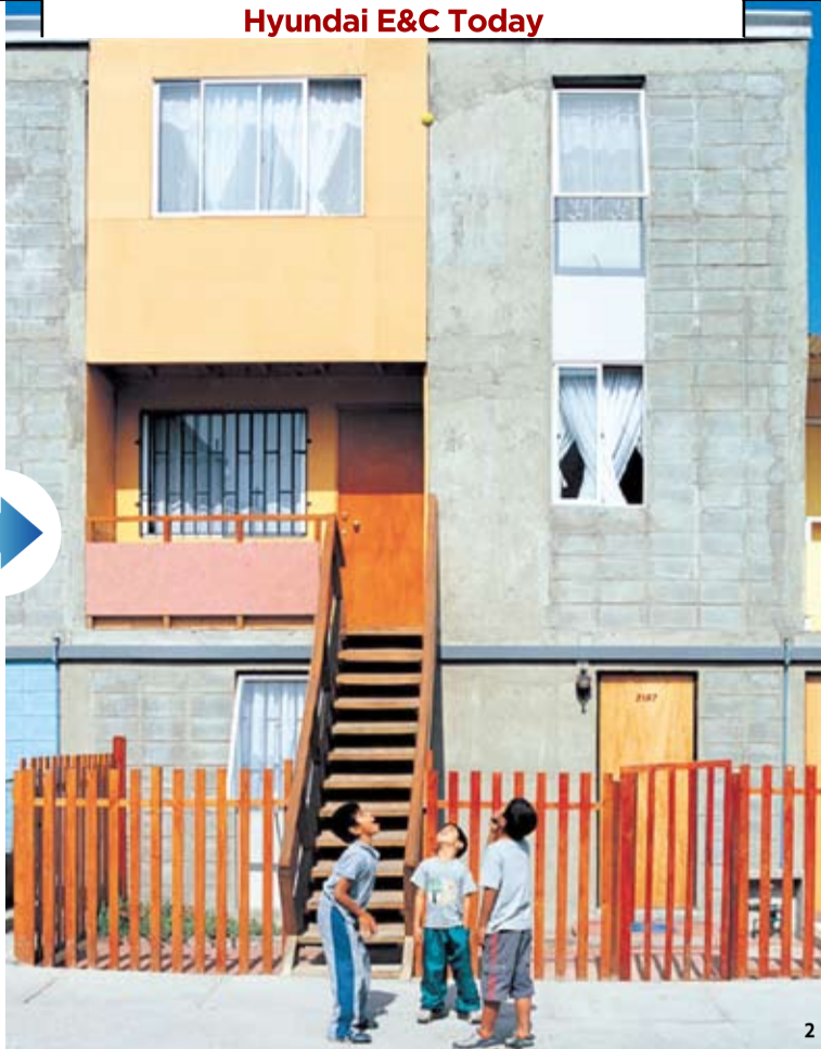
1, 2 반쪽짜리 집 키타 몬로이(Quinta Monroy) 공공 주택 프로젝트. 1은 반쪽 주택을 제공할 당시, 2는 주인이 살면서 완성한 주택. © Cristobal Palma, 3 UC 혁신 센터(UC Innovation Center-Anacleto Angelini), © Nina Vdic, 4 쓰나미 이후 칠레 콘스탄티티온 도시 재건 계획, © Felipe Diaz