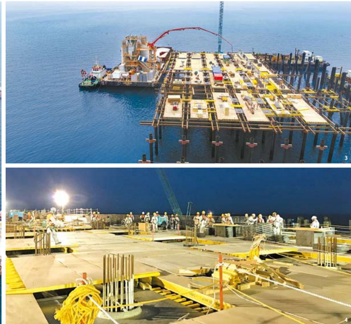
쿠웨이트 신규 정유공장 해상공사 현장 거리는 멀지만 대규모 프로젝트 수행으로 우리 회사에게는 친숙한 나라, 쿠웨이트. 수도 쿠웨이트에서 90km 떨어진 알 주르 지역에 세계 최대의 정유공장 공사가 한창이다. 5가지 패키지로 구성된 이 공사 중 우리 회사는 해상출하시설 패키지 공사를 맡아 2019년 12월 준공을 향해 달려가고 있다. 글=김보나