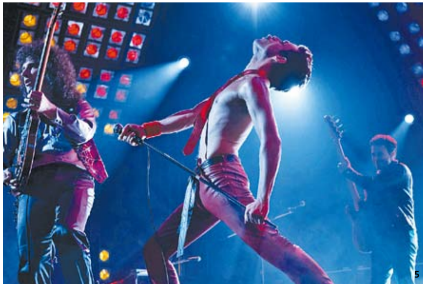
1,3 <미스터 션샤인>(tvN) 한 장면. 2 방탄소년단. 4 <골목식당>(SBS). 5,6 <보헤미안 랩소디> 스틸컷. 7 <수미네 반찬>(tvN).