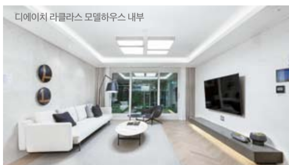
디에이치 라클라스 모델하우스 내부

THE H La Class, a reconstruction project consisting of six apartment buildings of 35 floors above ground and four basement levels in Banpo-dong, Seoul, garnered a lot of attention prior to the subscription as the builder's high-class, premium apartment complex would be supplied in the Banpo area well known for one of the Seoul's best school districts and its great accessibility. In addition, market observers say that Hillstate Nokbeon Station attracted interests of prospective buyers due to its good accessibility to the large-scale new town near Nokbeon Station on Seoul Subway Line 3.